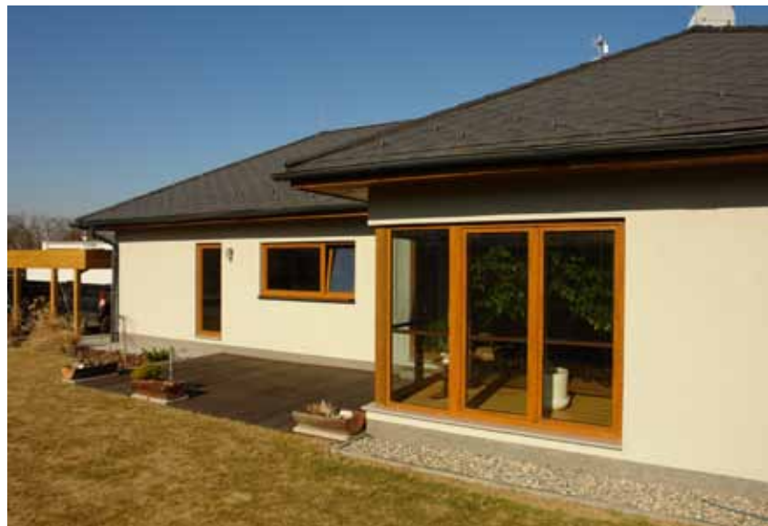
V zimních měsících napomáhají velké prosklené plochy k prohřívání interiéru, v létě tomu naopak brání velké přesahy střechy, které dávají stín

dostatečně vysoký půdní úložný prostor. Těsně před započítím stavby zadali architektce ještě doladění některých částí projektu, například upravení příček či osazení dveří tak, aby se do prostoru vešla vybraná kuchyňská linka nebo do druhé koupelny sprchový kout apod.