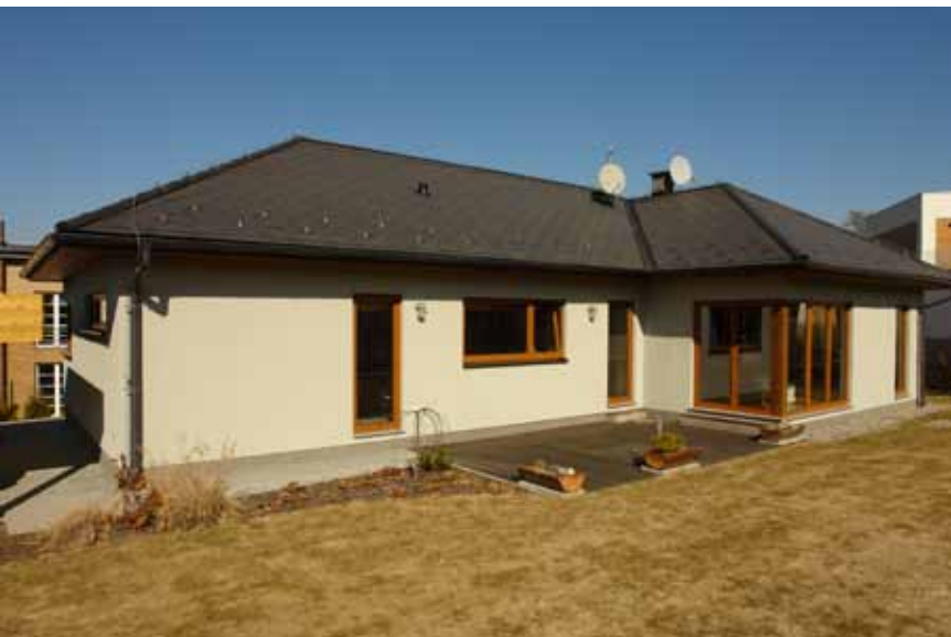
Pohled na terasu. Rohová francouzská okna otevírají obytný prostor slunci, propojují jej se zahradou a dodávají stavbě na osobitosti