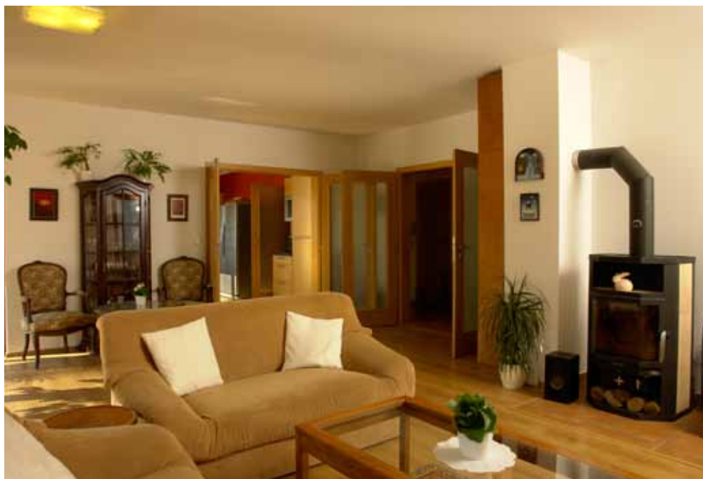
Obývací pokoj dokazuje, že i novostavba si může rozumět se starožitným nábytkem. Dům je vybaven podlahovým vytápěním s tepelným čerpadlem, funkci tepelného zdroje jsou připravena příležitostně převzít krbová kamna

Jako konstrukční řešení rodina zvolila dřevostavbu ze sendvičových stěn, vyráběných přímo firmou AWIK, na doporučení architektky zvolili oproti standardní betonové